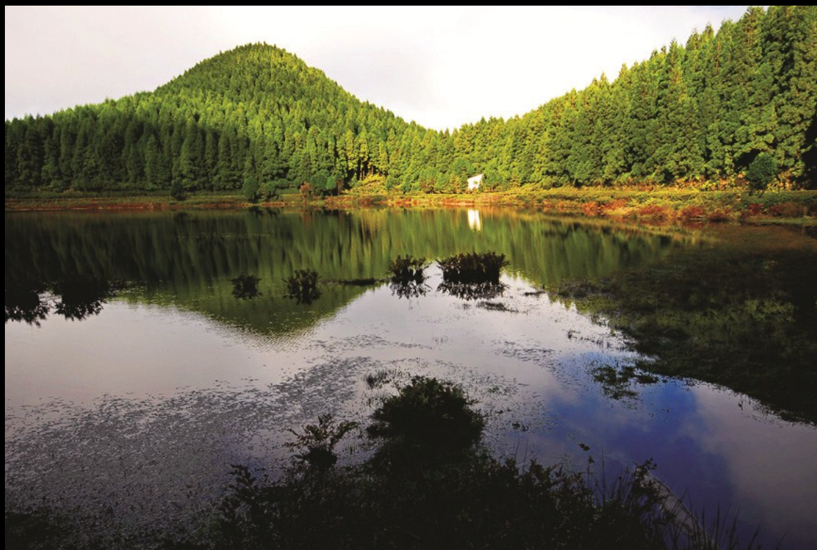
Lagoa das Empadadas, Serra Devassa — São Miguel