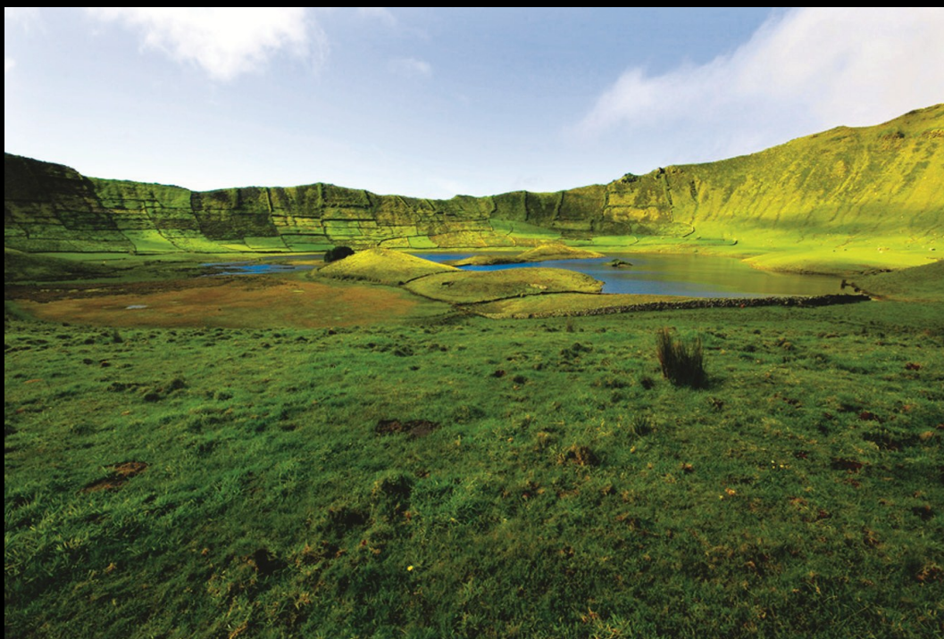
Caldeirão - Corvo

A Associação Geoparque Açores marcou presença em diversos eventos de natureza nacional e internacional. Destacam-se, também, diversas atividades das entidades parceiras do Geoparque Açores.