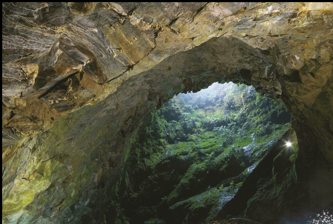
Algar do Carvão - Terceira

A Associação Geoparque Açores marcou presença em diversos eventos de natureza nacional e internacional. Destacam-se também, diversas atividades das entidades parceiras do Geoparque Açores.