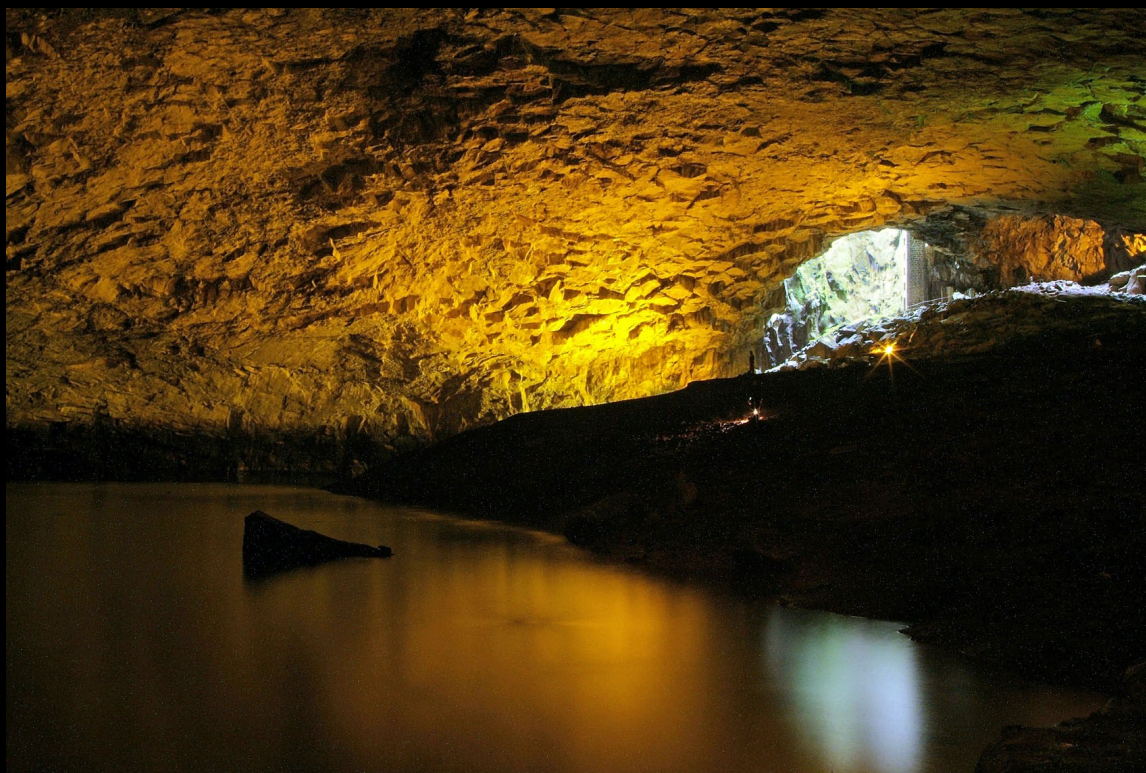
Furna do Enxofre — Graciosa