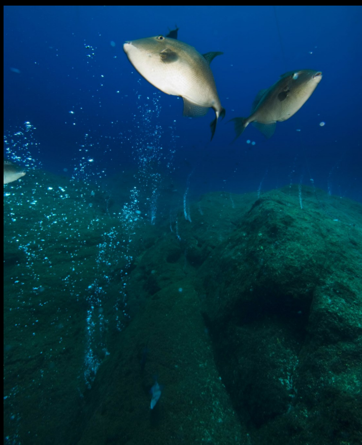
Banco D. João de Castro

O trimestre terminou com a entrada do Geoparque Açores na Rede Europeia de Geoparques, no dia 21 de Março, sendo o 53º Geoparque Europeu.