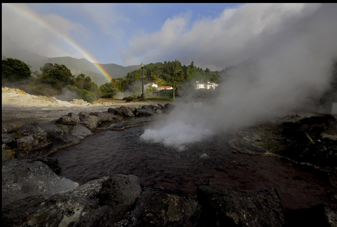
Caldeira do vulcão das Furnas—São Miguel