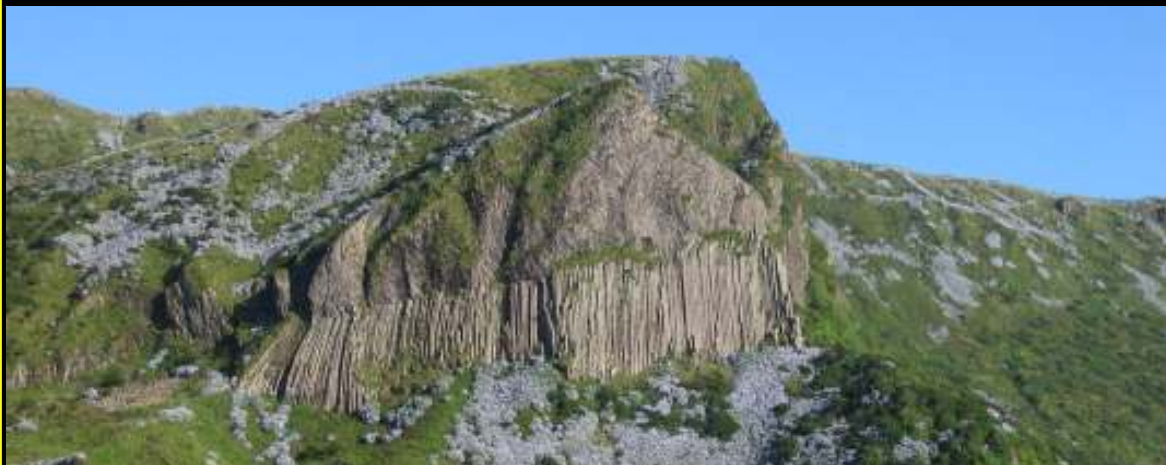
Rocha dos Bordões—Flores

São, também, apresentadas algumas notas sobre o estudo dos geossítios que se salientarão no Geoparque e sobre a criação do seu organismo de gestão (associação); as referências ao projecto Geoparque Açores na comunicação social e os materiais promocionais desenvolvidos no âmbito do mesmo projecto.