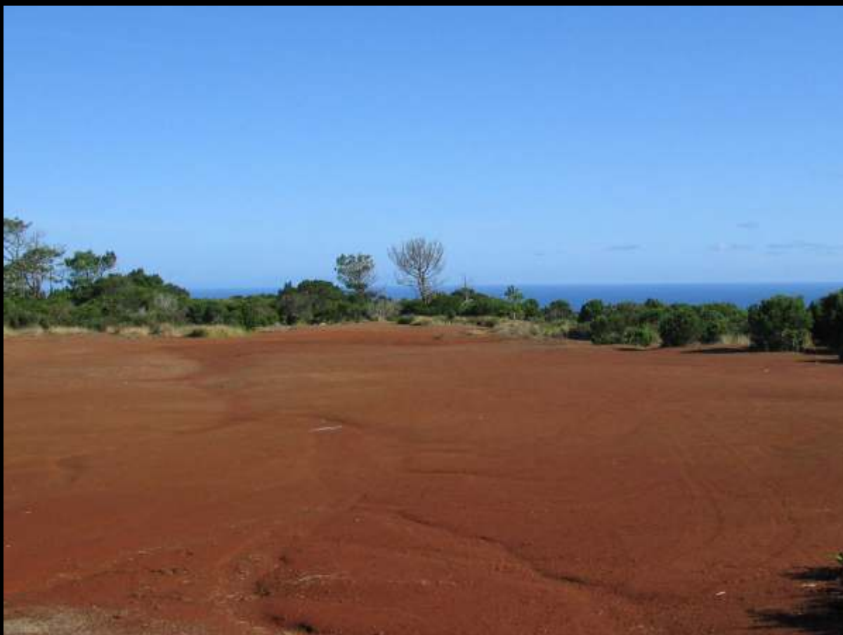
Barreiro da Faneca—Santa Maria