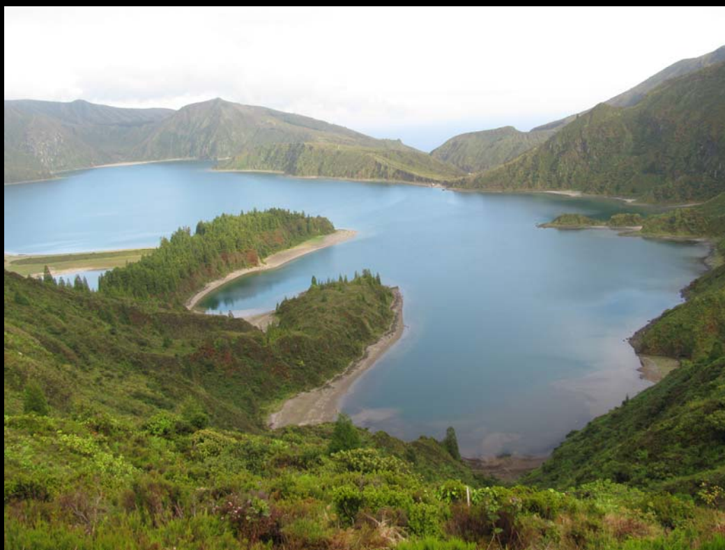
Lagoa do Fogo — São Miguel

Dá-se conta, ainda, de algumas das realizações programadas para o 4º trimestre de 2010.