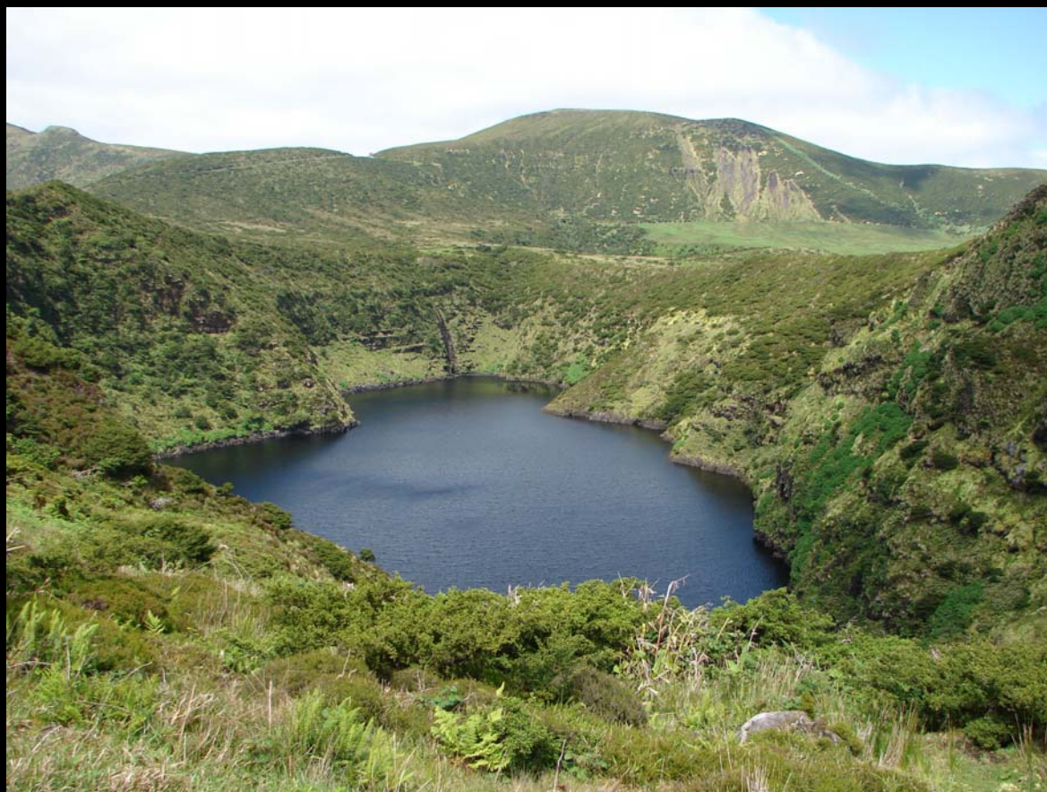
Lagoa Comprida – Flores