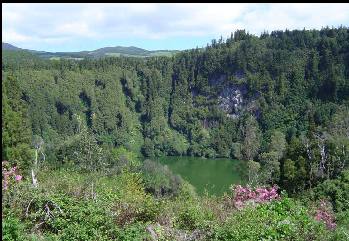
Lagoa do Congro — São Miguel

Apresentam-se, ainda, os mais recentes materiais de divulgação do projecto Geoparque Açores, produzidos pela Associação.