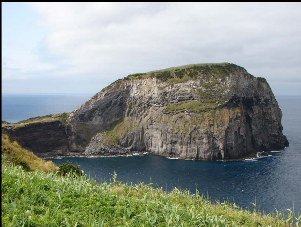
Morro do Castelo Branco – Faial